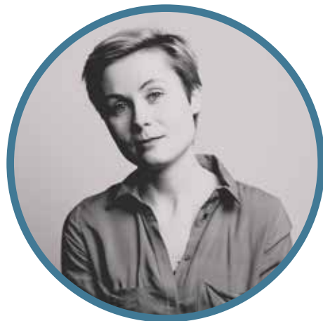
Door: Eef van der Worp

Ruim 30% van alle uitkeringsgerechtigden ontvangt psychische zorg en vindt moeilijk een baan, terwijl werken juist helpend is bij het herstel van een psychische aandoening. De uitgaven voor de GGZ zijn de laatste jaren verdubbeld en de mensen met een uitkering zijn voor 58,2% verantwoordelijk voor de stijging. De gemeenten, GGZ en UWV kaartten dit probleem aan en vroegen om innovatieve ideeën om de arbeidsparticipatie te verbeteren (ANP, 2017).