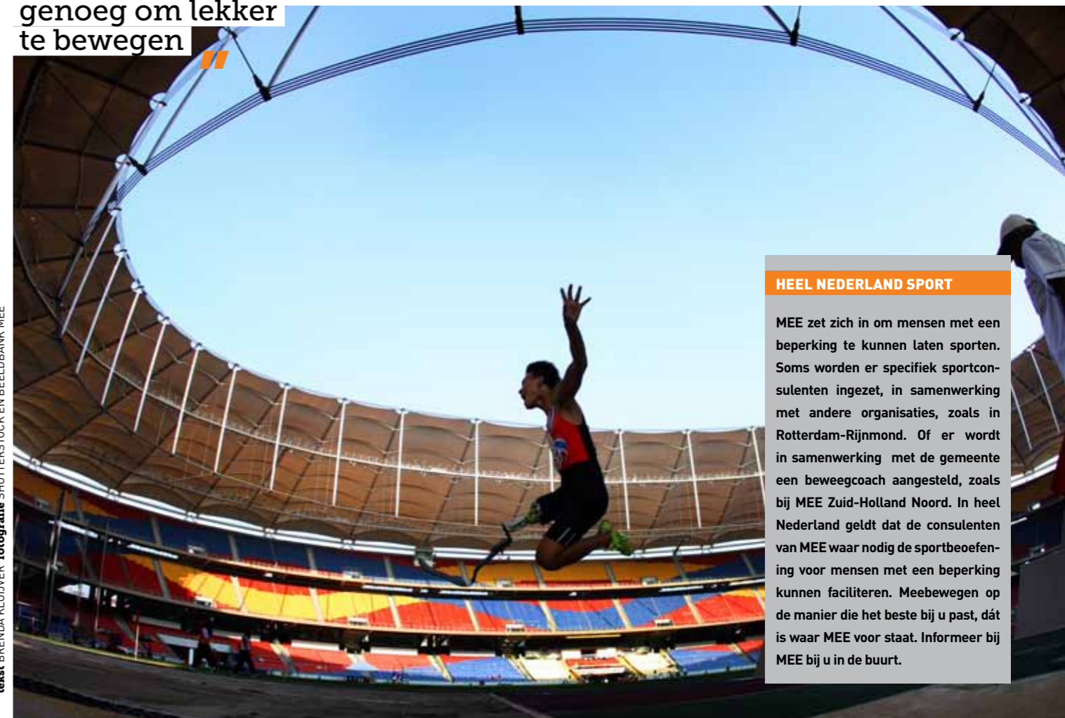
tekst BRENDA KLUJVER