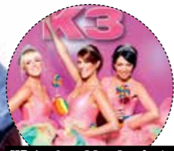
K3 is de allerleukste meidengroep

tekst SUZANNE GEURTS