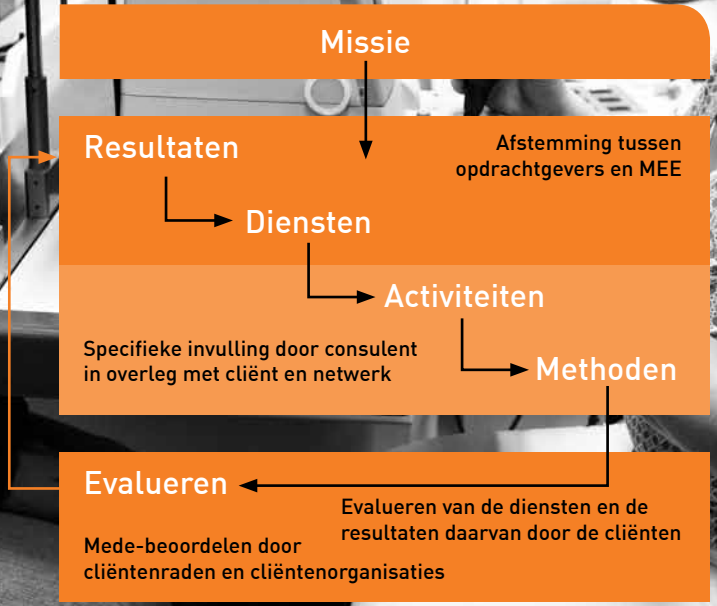
Schematische weergave van de inleiding van het dienstenboek